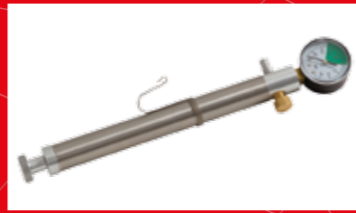
VÁLVULA de seguridad