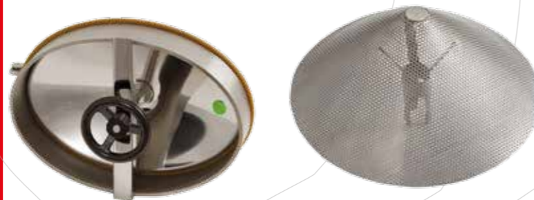
BOCA ENTRADA DE HOMBRE apertura interior