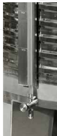
NIVEL CON GRIFO PURGADOR y escala graduada

A petición del cliente, se puede variar las medidas, forma constructiva y accesorios. Solicítenos presupuesto sin compromiso.