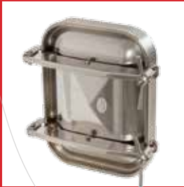
Boca rectangular (400 x 530 mm) Boca rectangular (430 x 730 mm)