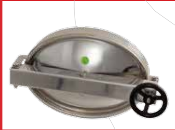
Boca entrada de hombre de apertura exterior