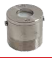
Válvula de seguridad