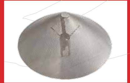
Rejilla para orujo