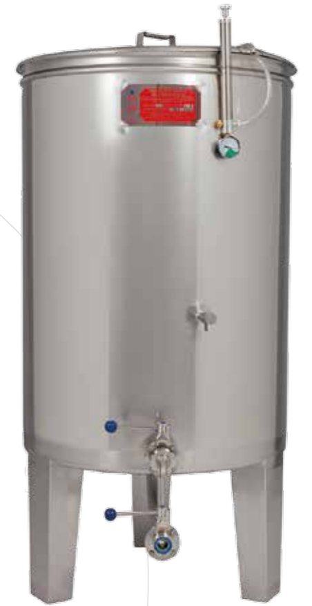
Siemprellena de 700 litros