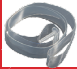
Cámara de aire + una de recambio

TAPA GUARDAPOLVO EN CAPACIDADES INFERIORES A 1.000 L.