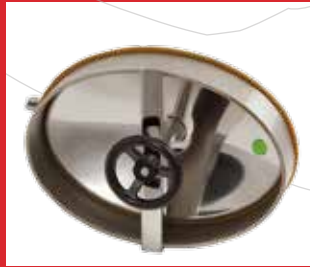
Boca entrada de hombre de apertura interior