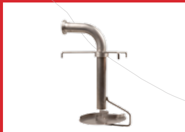
Difusor de molinete para tubo de remontado